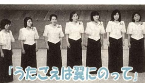
「うたこえは翼にのって」 みんなでつくり、みんなで楽しむ素敵なコンサート。

今年度は海上自衛隊東京音楽隊のバンド演奏やバンドと市民合唱講座参加者による大コーラスがあります。