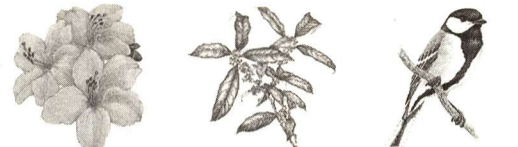
市の花・つつじ 市の木・もくせい 市の鳥・シジュウカラ