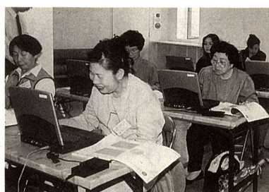
パソコンなんてこわくない...IT講習会にて(平成13年5月8日)

5月、6月に実施の初心者パソコン教室に引き続き、7月、8月コースを行います。詳しくは左表をご覧ください。9月以降も開設の予定です。 パソコン超初心者の方のためのメールやインターネットの仕方、文章作成の講習会です。まずはどんなものか試してみてください。初心者同士、わいわいガヤガヤ楽しみましょう。 対象 市内に在住、在勤、在学の成人の方。 内容 パソコンの操作方法とメール、インターネットを