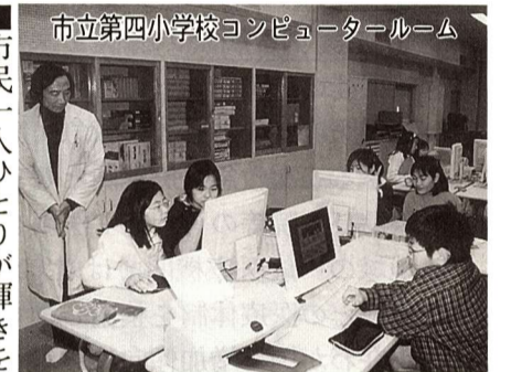
市立第四小学校コンピュータールーム

■市民が充実した日々を過ごし、生き生きと人生を送るために、生涯学習の充実に努めます。