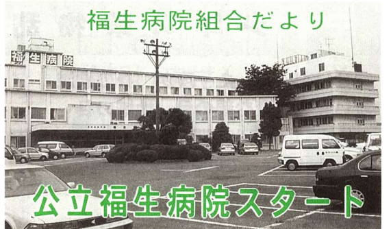
福生病院組合だより 公立福生病院スタート

4月1日、希望の公立福生病院が誕生しました。これは、福生市・羽村市・瑞穂町が共に手を携え、医療体制の充実を図ることに