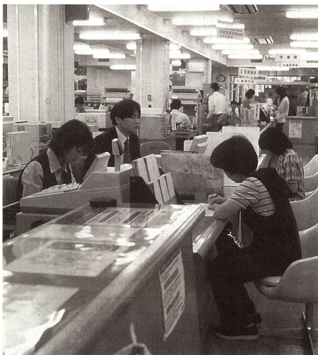
効率的な組織運営をめざし 4月1日付けで組織改正が行われる

福生市のホームページ http://www.city.fussa.tokyo.jp/