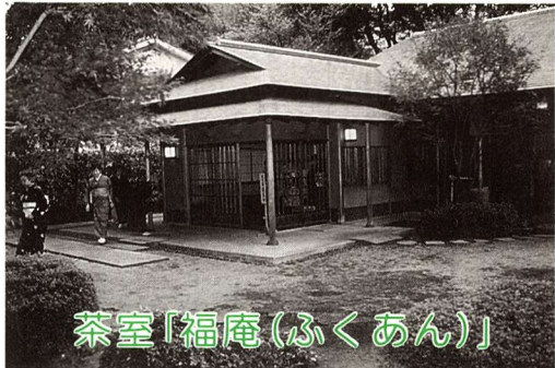
茶室「福庵(ふくあん)」

▽住所 福生市熊川854-3 (☎530・7177) ▽開館時間 午前9時〜午後10時 ▽休館日 月曜日、国民の祝日の翌日(月曜日にあたるときは、その翌日)および年末年始 問合せ 市民会館(☎552・1711)