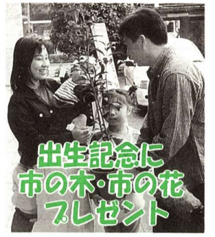
出生記念に 市の木・市の花 プレゼント