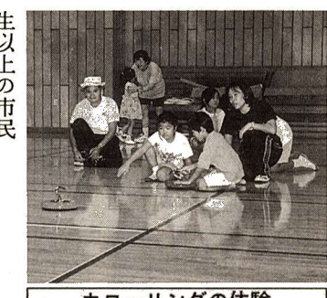
カラーリングの体験

期日 10月8日(日) 場所 熊川地域体 育館 対象 市民 輪投げ大会(市民総合体育大会 時間) 受付 午前9時30分・▽開 始 午前10時 種別 幼児の部、小 学校低学年の部、高学年の部、一 般男子の部、女子の部、中学生以 上、ベテランの部(60歳以上)、 障害のある方男子・女子の部 カラーリング体験講習会 氷上で行うカラーリングを室内 で楽しむ競技です。 時間 輪投げ大会終了後 対象 小学 生以上