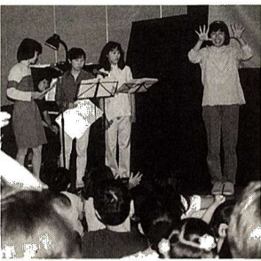
昨年度の白梅まつり

▼展示のひろば 午前10時～午後5時：生け花・陶芸・子ども創作絵画・書道・パッチワーク・水