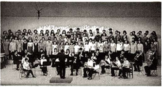
みどりのハーモニー 2000年