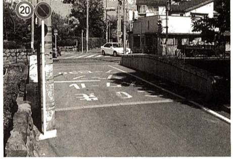
昭和62年3月、調査の結果老朽化しモルタル塗装のはがれた橋面や、安全性などを重視し、平成5年度に至り、玉川上水に架かる橋梁であることから、美観を十分考慮して旧態を尊重し修復したものであります。

江戸期の地誌『新編武蔵風土記稿』「福生村」の項に、「高札場」小名 宿にあり。と記されています。 「宿」とは名主家の屋敷を中心とした村内の一地域で、紺屋・味噌屋・足袋屋・さなぎ屋・下駄屋・屋根屋・鍛冶屋・車大工・酒造等の家々を含めた、村一番の集落でした。「福生の渡し」(多摩川の渡船場の一つ)を越えて、「上・下江戸道」・「八王子道」・「青梅」の道につながり、「下江戸道」の玉川上水に架けられたのがこの「宿橋」でした。 粗末な木製の橋が、昭和11年12月に現在の鉄筋コンクリート造りの橋として竣工し、