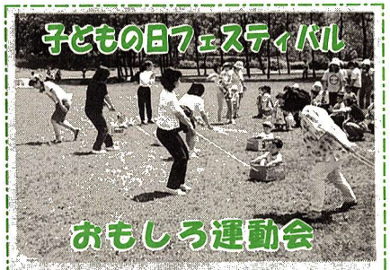
子どもの日フェスティバル

おもしろ運動会 期日 5月5日(祝) 受付 午前10時から 競技 午前10時30分～午後零時30分 ※雨天の場合は、田園児童館内で規模を縮小して行います。 場所 多摩川中央公園でっかいひろば 対象 幼児(保護者同伴)～小学生 定員 150人 ※定員に満たない場合は当日も受け付けます。 申込み 4月20日(木)から田園児童館(☎552・3133)へ。