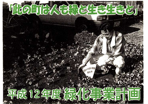
平成 12 年度緑化事業計画

※日程などの変更がある場合もありますので、個々の事業の詳細についてはその都度お知らせします。また、この事業以外にも、市制施行 30 周年の冠をつけた事業も実施される場合があります。