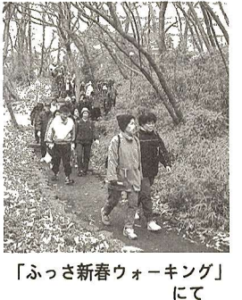
「ふっさ新春ウォーキング」にて

使用期間 4月1日(土)～10月31日(火) ※学校校庭は11月30日(木)までです。 問合せ スポーツ振興課スポーツ振興係(☎552・5511)へ。