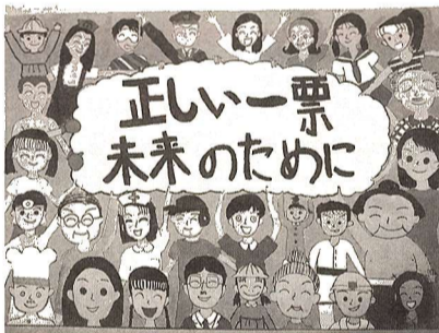
「正しい一票 未来のために」 入選作品

今後4年間の福生市政を任せる市長を選ぶ大切な選挙です。住みよい福生を築くため必ず投票しましょう。問合せ 選挙管理委員会事務局(内線522)へ。