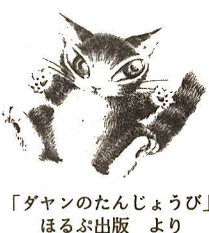
「たんじょうび」ほるぶ出版より

絵本やキャラクターグッズでもおなじみのねこのダヤン、そして仲間たちがおりなす不思議な世界(わちふいー)を描いた「池田あきこ絵画展」を開催します。ご来館ください。 日時 2月15日(火)〜20日(日) 午前10時〜午後5時 場所 中央図書館2階会議室 ※入場無料 問合せ 中央図書館へ。