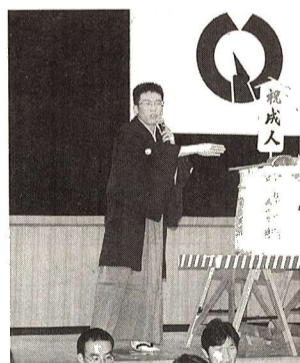
▲会場を盛り上げる「成人のつどい」実行委員

成人の日が1月の第2月曜日となって初めての成人式が、1月10日、市民会館で開催されました。式典終了後に行われた「成人のつどい」は、新成人の皆さんの企画によるもので、立食パーティー・記念撮影コーナー・思い出の写真展示コーナーなどでは、出席した皆さんが久しぶりに再会した友人との会話に花を咲かせていました。