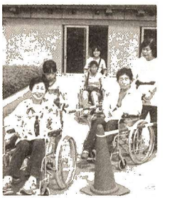
▲10月3日の「福祉まつり」にて

農林水産省では、平成12年2月1日現在で「2000年世界農林業センサス」を実施します。農家等に1月下旬から2月中旬にかけて調査員がお伺いして、農林業の経営状況などをお尋ねしますので、ご協力をお願いします。問合せ 庶務課庶務係(内線252)へ。