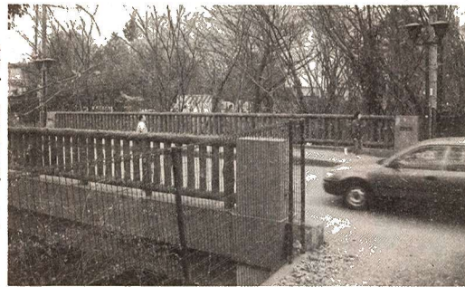
竣工 昭和61年3月 (撮影 平成12年1月)