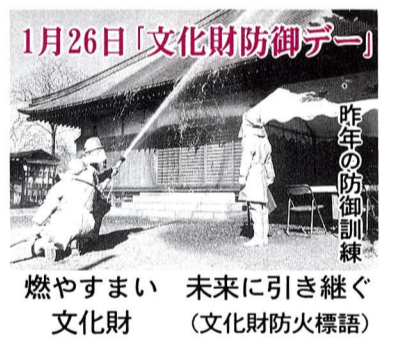
燃やすまい 未来に引き継ぐ文化財 (文化財防火標語)