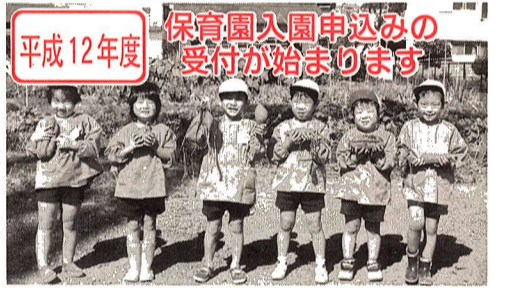
平成12年度 保育園入園申込みの受付が始まります

保育時間 午前8時30分~午後5時 >特例保育 午前7時15分~午後6時15分まで保育します。*市内全園で実施 >延長保育 特例保育を、さらに時間延長(午前7時~午後7時15分)して保育します。指定保育園のみ実施しています(上表参照)。 *ご希望の方は、入園後、保育園に直接ご相談ください。