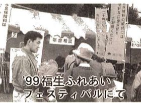
99福生ふれあいフェスティバルにて