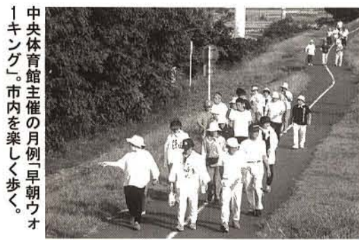
中央体育館主催の月例「早朝ウォーキング」市内を楽しく歩く。

◆「教育、文化」 幼時教育における家庭教育との連携、就園奨励、保護者負担の軽減 児童生徒一人ひとりの個性を生かした教育内容の充実、道徳、健康、環境、福祉、情報化、国際理解など幅広い分野での学習、家庭や関係機関等と連携した児童生徒の健全育成、地域活動の場としての学校の活用、地域への愛着と誇りをもち、道徳心のある子どもた