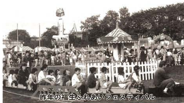
昨年の福生ふれあいフェスティバル