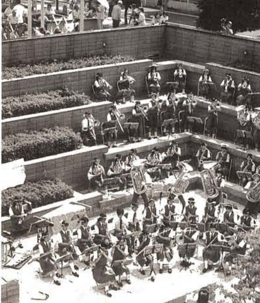
10月3日、福祉センターで行われた「福祉まつり」に福生二中吹奏楽部が参加。日本民謡や愛唱歌などの楽しい演奏が、心地よく中庭に響き渡った。

◆「教育、文化」 幼時教育における家庭教育との連携、就園奨励、保護者負担の軽減 児童生徒一人ひとりの個性を生かした教育内容の充実、道徳、健康、環境、福祉、情報化、国際理解など幅広い分野での学習、家庭や関係機関等と連携した児童生徒の健全育成、地域活動の場としての学校の活用、地域への愛着と誇りをもち、道徳心のある子どもた