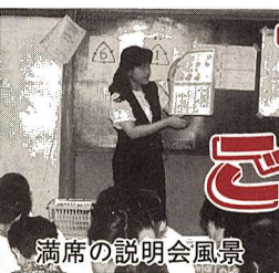
満席の説明会風景