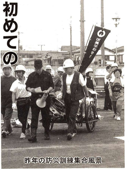
昨年の防災訓練集合風景

災害は、いつ襲ってくるかわかりません。夜間に災害が発生したとき、どのように行動したらよいのか、夜間防災訓練で体験してください。