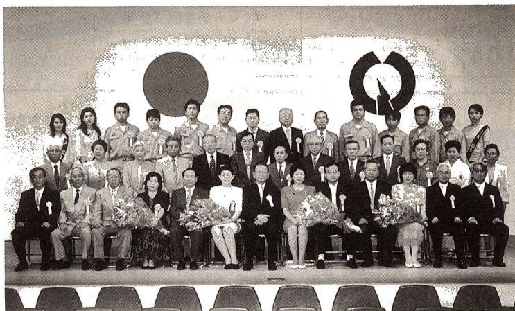
市民会館において35人の方が表彰されました