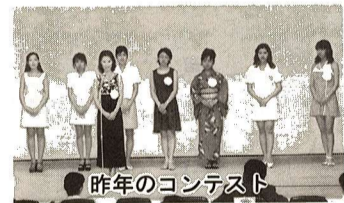
昨年のコンテスト

教育団体、PTA、子供会などの市民団体や市内の事業所の有志の方(代表者は市内在住の方に限ります)。保健所、警察署および消防署の許可を受けられる方。自家発電装置は禁止します。また、7月18日(日)の抽選会および出店説明会に出席できる方。 ※個人の出店、営利目的の方の出店できません。 募集店数 100店 費用 出店負担金2,000円、 ※申込多数の場合は抽選となります。