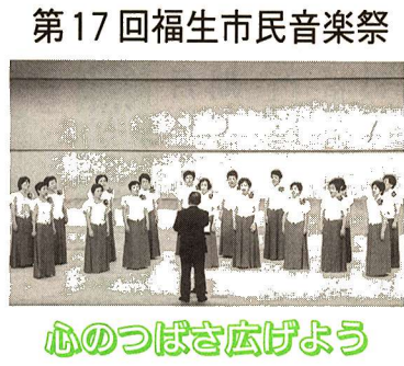
心のつばさ広げよう

公民館本館 ☎ 552・1711 公民館松林分館 ☎ 552・3624 公民館白梅分館 ☎ 553・3454