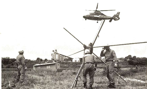
平成7年5月の水防演習

参加部隊 第九方面隊(福生、青梅、秋川、奥多摩、八王子、日野、町田、多摩)、第一、第