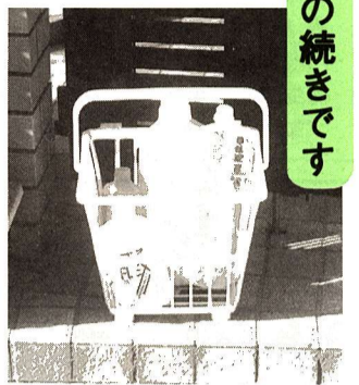
モデル地区で開始した「ごみと資源の収集方法」の主な改正内容