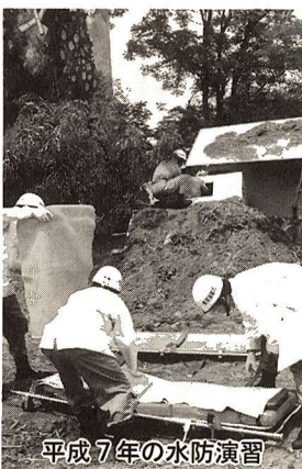
平成7年の水防演習

この演習に伴い、16日及び17日は多摩川中央公園内並びに自転車専用道路(多摩橋〜五日市線間)は、使用・通行ができません。ご協力をお願いします。