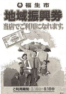
地域振興券は、このポスターが貼ってある店舗・事業所で使用できます。

4月9日(金)まで土曜・日曜を含めて特別窓口を設け、交付申請を受け付けています。 時間 午前8時30分～午後5時 場所 福生市商工会館3階