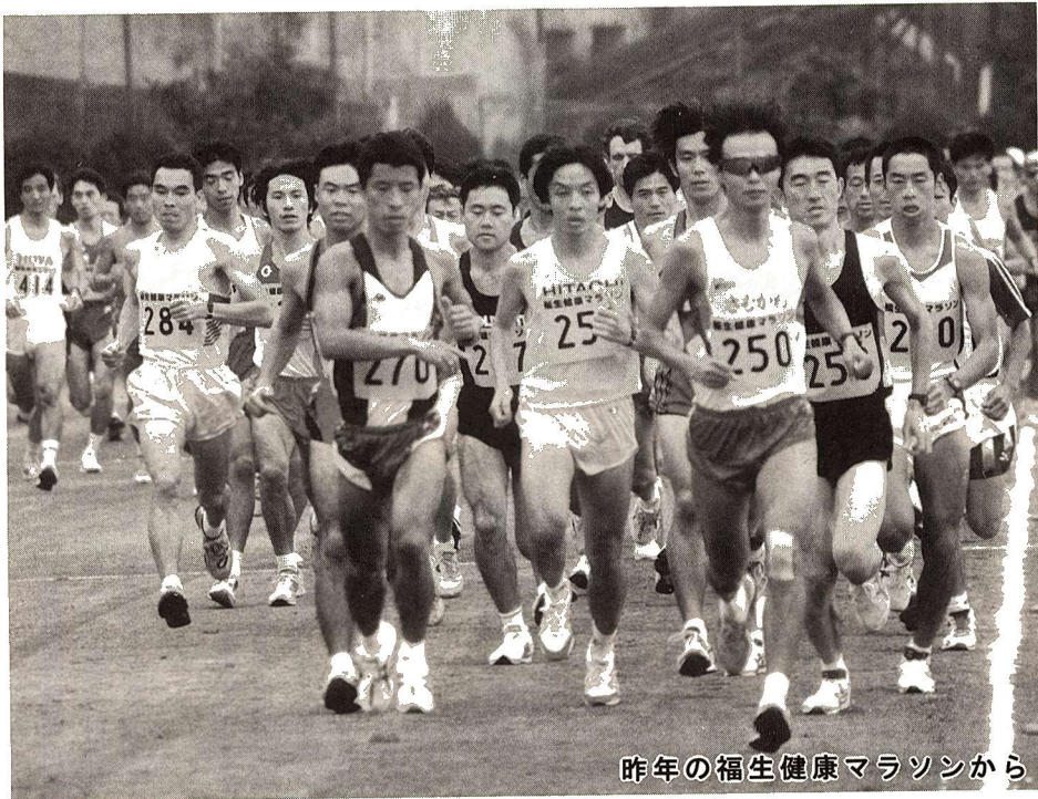
昨年の福生健康マラソンから