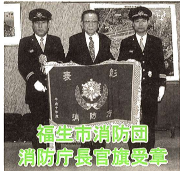
福生市消防団 消防庁長官旗受章

この表彰旗は、防災思想の普及、消防施設の整備、その他の災害防衛に関する対策の実施について、優秀でかつ他の模範になると認められた消防機関に授与されるものです。