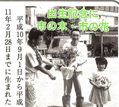
平成10年9月1日から平成11年2月28日までに生まれた

赤ちゃんに、市の木(もくせい)、または市の花(つつじ)の苗木を差し上げます。対象となる赤ちゃんにはハガキでお知らせします。 配布日時・場所 4月29日(祝) 午前10時～正午・午後1時～4時 福生市役所前庭 問合せ 経済課農業緑化係(内線323)へ。