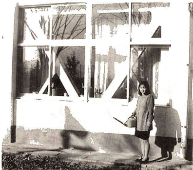
▲一中の窓側の補強工事

なお、この工事に合わせて窓からの採光を改善したり、教室を広げ新しい授業展開にあつた環境作りにも役立っています。今後も継続して、市内の小中学校の工事も実施する予定ですのでご協力をお願いします。また、現在改修中のさく