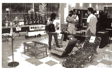
▲リサイクルプラザでリサイクル品の展示・販売