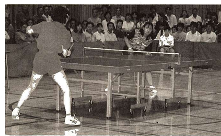
▲一流スポーツ観戦事業（卓球）