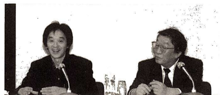
▲福生市初の試み「まちづくりシンポジウム」