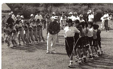
▲福生スポーツフェスティバル