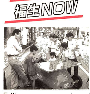
「夢のソーラーカー」

燃料のいらぬ自動車は十一年程前には夢のような話でした。最近、燃料代のかからないソーラーカーが作られ、各地でレースが開催されるようになりました。