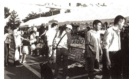
▲インポートフェア