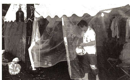
▲市民による災害宿泊避難訓練