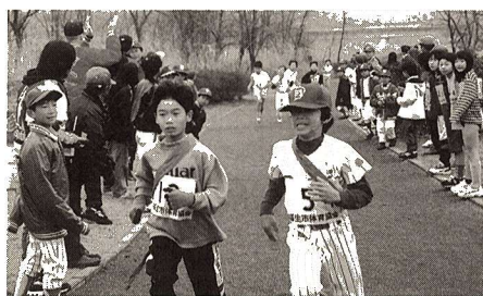
▲第1回福生市民駅伝大会