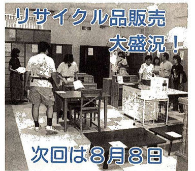
リサイクル品販売 大盛況! 次回は8月8日

福生市では、公共工事などの入札結果(工事件名、落札業者など)を閲覧方式により、財政課契約係の窓口で公表しています。閲覧の時間は執務時間内です。なお、電話などによる入札結果のお知らせは行いません。