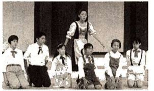
「コーラスのWA たのしいWA」

コーラスやブラスバンドに加えて、公民館の合唱講座で練習したオペラから2曲の大合唱を聞いていただきます。