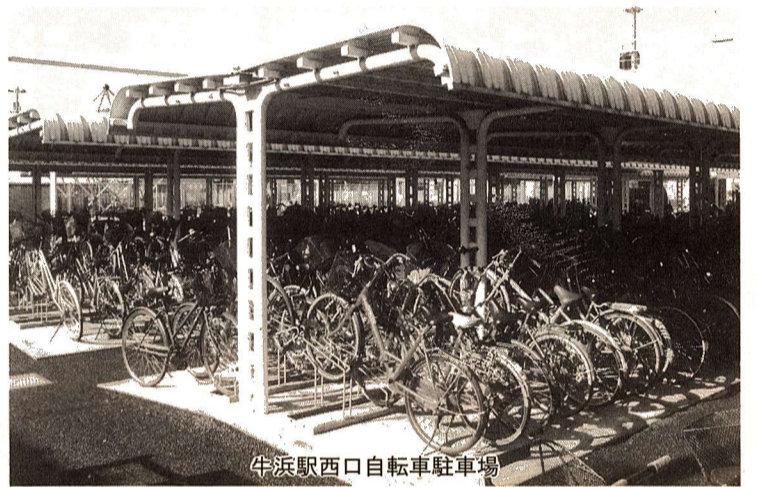
牛浜駅西口自転車駐車場

これまで市内に7ヶ所の自転車等駐車場を設けていますが、より安心して使いやすい駐車場とするために、より健全な財政を維持するために、自転車等駐車場が7月1日から有料になります。有料になると、通勤通学の定期利用をしている方は、自分の置く場所が決まりますので、い