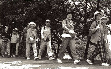
多摩川沿いを歩こう!

日時 5月31日(日)午前8時30分 ※雨天中止 集合場所 中央体育館 解散場所 立川公園(JR立川駅) 徒歩15分 行程 中央体育館→多摩川中央公園→南公園→拝島橋→多摩大橋→立川公園(約12km) ※完歩者全員に完歩証をさしあげます。