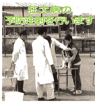
新規登録と予防注射の日程

転入などの届け出が遅れていても、資格のできた月にさかのぼって保険料を負担していただくこととなります。 問合せ 保険年金課給付係(内線312)へ。