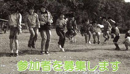
参加者を募集します