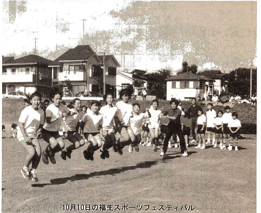
10月10日の福生スポーツフェスティバル

今後のまちづくりを進めてまいりますには、各種使用料や手数料なども含めて応分の負担をいただかなければならなくなってきているものと思っています。福生市を自分自身のまちとして、自立する都市として構築し、成長させていっていただきたいと願っています。