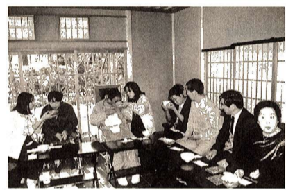
自分で制作したお茶わんでお点前をいただく障害者デイの利用者

性デイホーム事業、さらには、24時間窓口開設の在宅介護支援センター事業につきまして、市内の社会福祉法人に委託して、その推進を図っております。