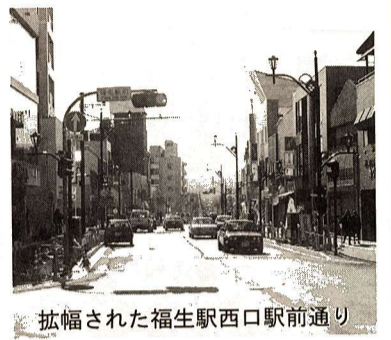
拡幅された福生駅西口駅前通り

座商業会の区間については、今後、両商業会と十分協議を進めながら整備の方向を出してまいります。