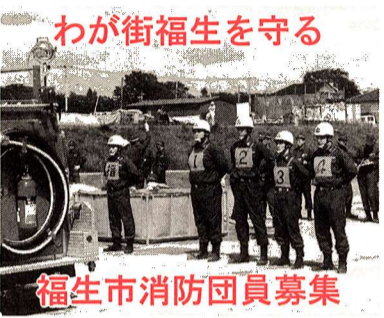
福生市消防団員募集

「わが街福生の安全を守る」という精神に基づき、消防団は、地域の防災リーダーとして幅広く防災活動を行っています。防災訓練などで市民を指導したり、火災などに対する警