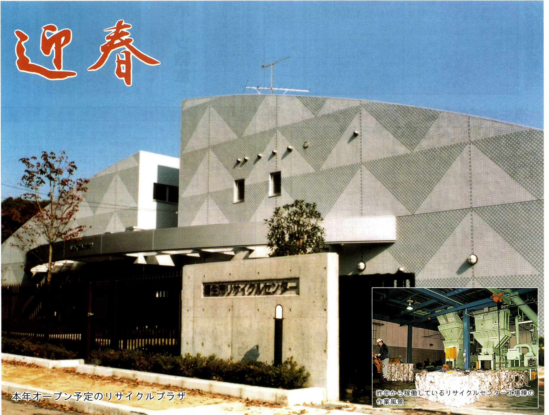
本年オープン予定のリサイクルプラザ