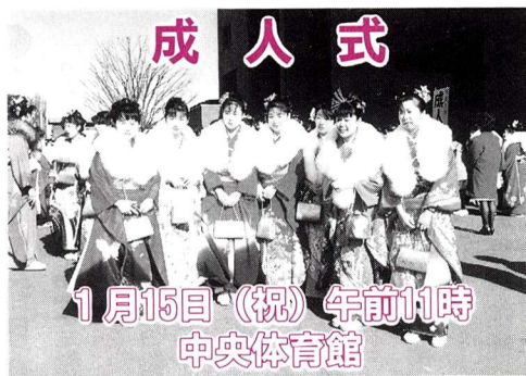
成人式 1月15日(祝) 午前11時 中央体育館

昭和52年4月2日から昭和53年4月1日までに生まれた方には案内状をお送りしました。なお、保護者の方も入場できますので、ご一緒にどうぞ。※欠席の方には、1月16日(金)から2月27日(金)まで(土曜日・日曜日・祝日を除く)の