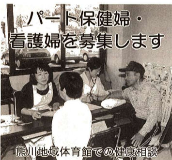
熊川地域体育館での健康相談