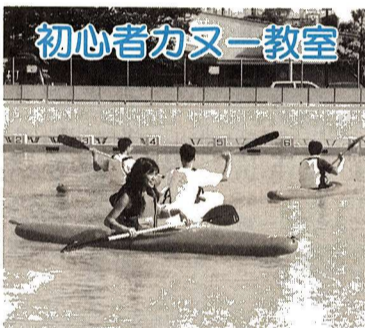
初心者カヌー教室

そぞろ涼風の立つ好時節、秋の花を探して一緒にウォーキングしませんか! 日時 9月14日(日) 午前9時 集合場所 国営昭和記念公園 ※小雨決行