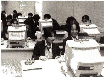
▲福生二中のパソコン授業風景 (本文の内容とは関係ありません)

第17回 だれもが一度は夢見るような「一生に一度の恋」を、しなやかな精神と勇気で勝ち取ったヒロイン、ポカホンタスの愛の物語。 監督 マイク・ガブリエル、エ