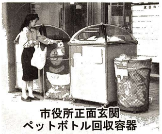
市役所正面玄関 ペットボトル回収容器

これは、今年4月から施行された容器包装リサイクル法に対応するため試験的に実施するものです。