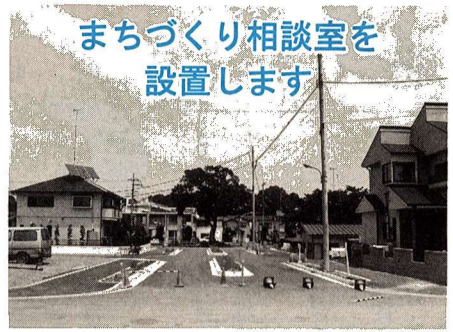
まちづくり相談室を設置します

す。幸いけが人はありませんでしたが、処理施設は大変な被害を受けました。福生市でも、中身が残ったままのスプレー缶が燃やせないごみに混ざって出されることがあります。このスプレー缶は、収集時には取り除けませんし、リサイクルセンターで処理する際にも人の手で選別するしか方法がなく、多量のごみの中からそのすべてを取り除くことは不可能です。爆発事故を未然に防ぐには、市民の皆さんのご協力が何よりも必要です。問合せ 福生市リサイクルセンター(☎52・1621)へ。