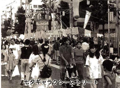
七夕ギャラクシーストリート