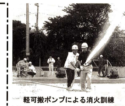
軽可搬ポンプによる消火訓練

行楽シーズン到来! 交通災害共済に加入しましたか? 会費 ▷一般 500円 ▷未就学児童 400円