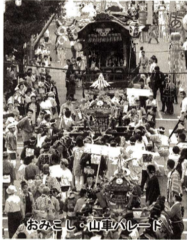
おみこし・山車パレード