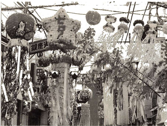
七夕まつり民踊パレード

七夕まつりを彩る福生民踊パレードにあなたのグループも参加してみませんか。 日時 8月8日(金) 午後5時 場所 銀座通りから中央通り、栄通りの間、約2キロ