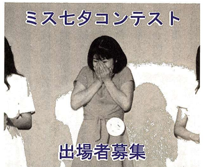
ミス七夕コンテスト

※参加賞を差し上げます。 申込み・問合せ 所定の申込書(福生市商工会にあります)に必要事項を明記のうえ、6月30日(月)までに、福生七夕まつり飾り付け部会(福生市商工会内(☎51・2927))へ。