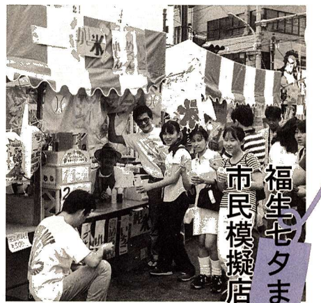
福生七夕まつり 市民模擬店出店団体募集

費用 2,000円(道路使用申請料) 出店資格 町会や自治会、社会教育団体、PTA、子供会などの市民団体や市内の事業所の有志の方。なお、個人の出店、営利目的の方の出店はできません。