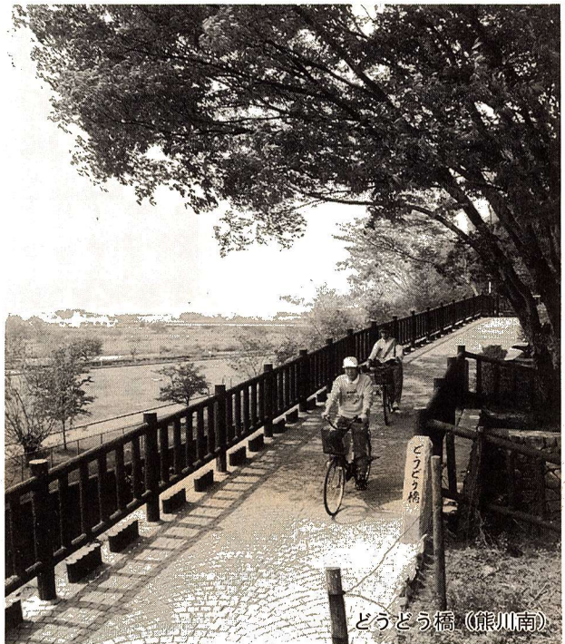
どうどう橋(熊川南)

市民の皆さんが日ごろ市政のことで気付かれたことや、ご意見、ご要望などを市政に反映させていくために、市では、市民相談、対話集会、電話、陳情のほか、世論調査などを通じて多くの市民の皆さんの声をお聴きしています。「市長への手紙」もその一つです。