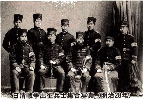
日清戦争出征兵士集合写真(明治28年)

郷土資料室では、近代・福生百年の足取りを写真からおつてみようとする写真展を開催します。