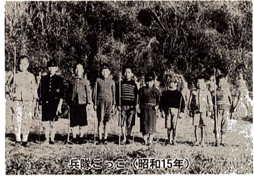
兵隊ごっこ(昭和15年)