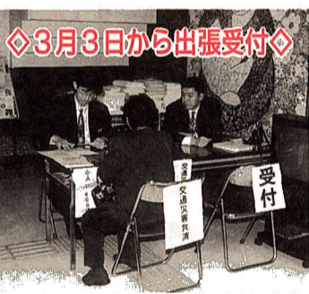
◆3月3日から出張受付◆

東京都の全市町村が共同で運営する、この交通災害共済は、少ない会費で方が一交通事故にあった場合に見舞金を受けられる共済制度です。 下表の日程で出張受付を行いますので、皆さんの加入をお勧めします。