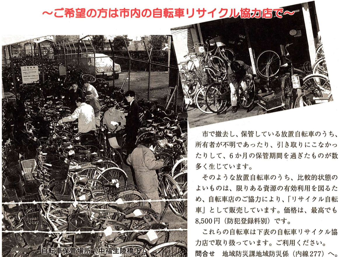
自転車保管場所(中福生陸橋下)

市で撤去し、保管している放置自転車のうち、所有者が不明であったり、引き取りにこなかったりして、6か月の保管期間を過ぎたものが数多く生じています。