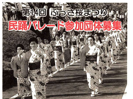
第14回 ぶっさ桜まつり 民踊パレード参加団体募集

自転車は駐輪場へ 駅前放置自転車は撤去します 市では、市内各駅(東福生駅を除く)周辺の自転車等放置禁止区域内に長時間放置された自転車などへ警告札を取り付け、その後撤去し、自転車保管場所へ保管しています。 なお、撤去した自転車などは持ち主を確認し、随時引き取りの連絡をしていますので、連絡を受けた方は保管場所に引き取りにきてください(撤去保管料(自転車1,000円、バイク2,000円)をいただきます)。 問合せ 地域防災課地域防災係(内線277)へ。