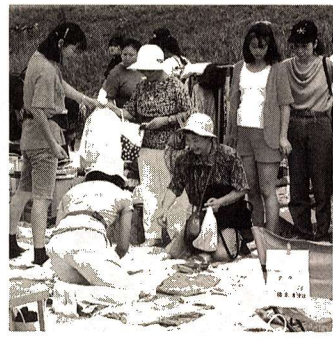
※雨天の場合は15日（日）に順延 場所 多摩川中央公園