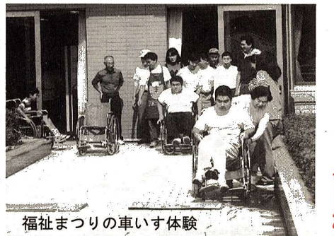
福祉まつりの車いす体験

◎重度の障害のため日常生活を営むのに支障のある心身障害者のおられる家庭であって、家事や介護などのサービスを