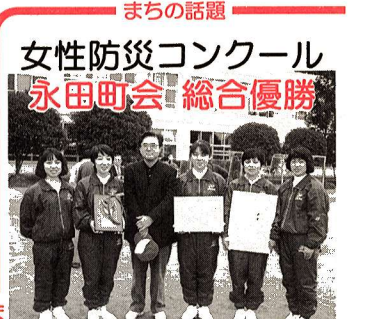
女性防災コンクール 永田町会 総合優勝

対象 3歳～5歳の視覚に障害のある(矯正視力0.3未満あるいは視野などの視機能異常を持つ)幼児 の低下が予測される)幼児 入学相談日 1月28日(火)