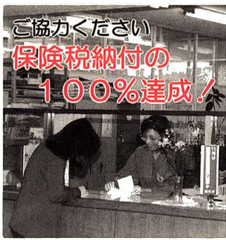
ご協力ください 保険税納付の100%達成！

パート保健婦・看護婦募集中 寝たきりの方の訪問指導事業に従事する保健婦・看護婦を募集します。 ◆募集人員 若干名 ◆資格 保健婦、または正看護婦の免許を有する55才までの方 ◆勤務日時 指定した日・時間に勤務していただきます。 ◆問合せ 在宅福祉課在宅サービスクラス係（福祉センター内）☎30・2941）へ。