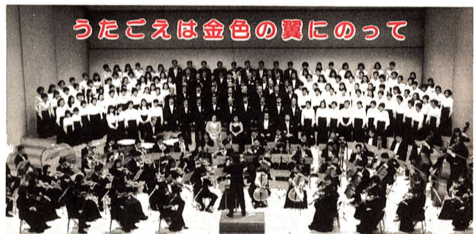
うたごえは金色の翼にのって