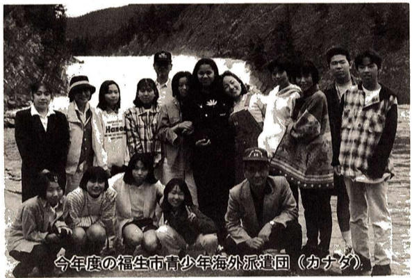
今年度の福生市青少年海外派遣団(カナダ)