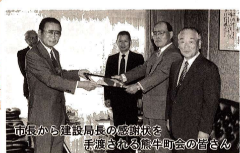
市長から建設局長の感謝状を手渡される熊牛町会の皆さん

毎年5月の日曜日に、町内会の公道や私道などの路面や側溝の清掃を30年以上にわたって行い、市内の美化に貢献している熊牛町会が東京都建設局長表彰を受けました。