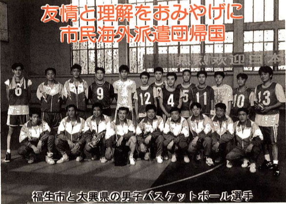
福生市と大興県の男子バスケットボール選手

10月10日から13日までの4日間、中国北京市大興県へ派遣されていた市民海外派遣団が帰国しました。大興県の方々との、バスケットボール交流では、真剣さのなかにも笑顔がこぼれるなど、和やかな雰囲気の中、友好を深め、相互理解を深めました。この貴重な経験が、これからの団員自身の生活や地域の活動に生かされることでしょう。