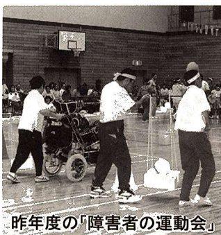
昨年度の「障害者の運動会」

利用料 入浴料 1、000円 ▽食事代 450円(おやつ代100円含む) ▽その他材料費など 実費