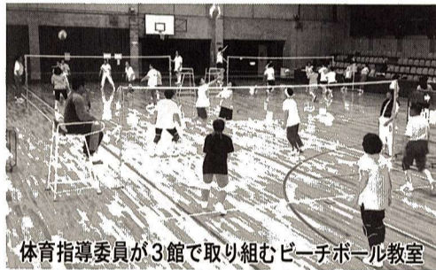
体育指導委員が3館で取り組むビーチボール教室

中央体育館 ☎52-5511へ。 熊川地域体育館 ☎52-1980へ。 福生地域体育館 ☎30-8811へ。