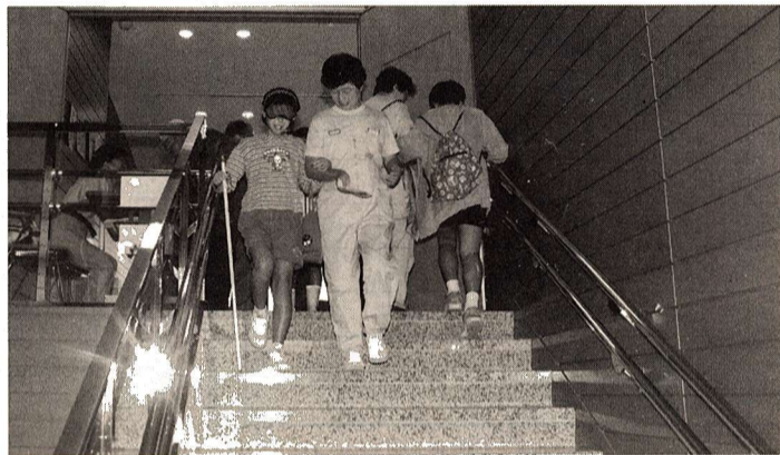
◎敷地内の通路 幅1・35m