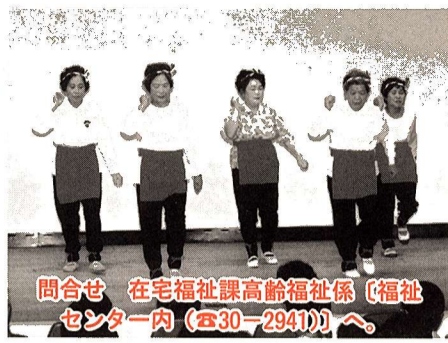
問合せ 在宅福祉課高齢福祉係(福祉センター内(☎30-2941))へ。