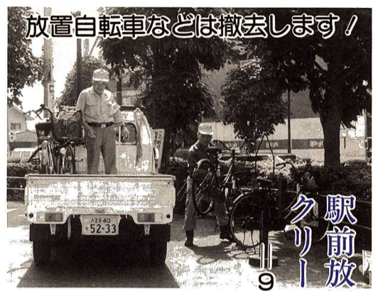
放置自転車などは撤去します!

市では、市内各駅(東福生駅を除く)周辺の自転車等放置禁止区域内の駅前広場や道路など、公共の場所に自転車などを長時間放置しますと、警告札を取り付け、その後に撤去し、自転車