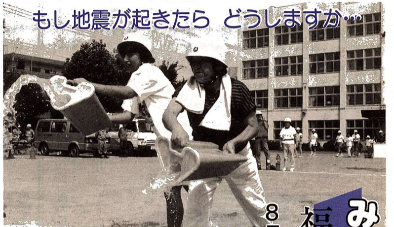
もし地震が起きたら どうしますか...

昨年、東京都消防操法大会でみごと優勝した福生市消防団が10月16日(水)、横浜市で行われる第15回全国消防操法大会に東京都代表として出場することになりました。団員は、6月から全国大会優勝を目指して、日夜練習に励んでいます。市民の皆さんのご声援をお願いします。