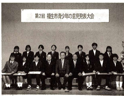
▲昨年の青少年の意見発表大会

あなたが日常生活を通じて考えていること、体験・心に残ったことなどを自由に発表してみよう。 応募資格 市内在住の中学生 主題 自由