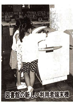
図書館の新しい利用者端末機

図書館は市民の皆さんの貴重な税金により運営されています。お互いに気持ちよく利用してください。 図書館は市民の皆さんの信頼の上に立って運営しています。一冊一冊の本を大切に利用をお願いします。