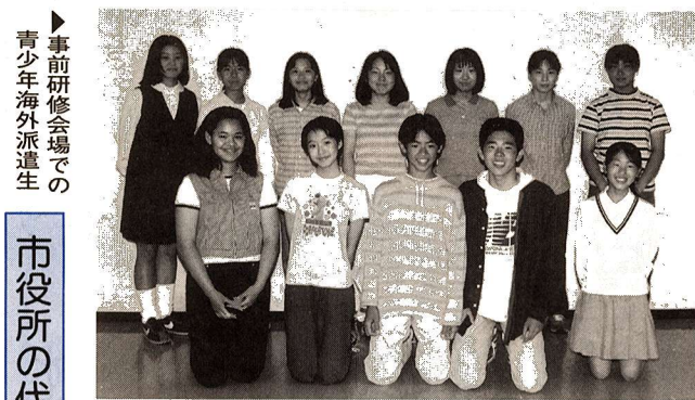
◎派遣生の皆さん◎ (敬称略)

1、2000字以内にまとめたものを添付して、直接、企画調整課企画調整担当へ。 募集期間 7月1日(月)～15日(月) 午前9時～午後5時 ※土曜日・日曜日は除く。 選考方法 書類審査、面接