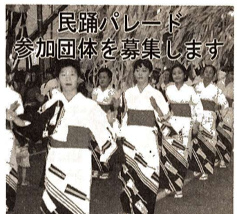
民踊パレード 参加団体を募集します

申込み・問合せ 福生七夕まつり実行委員会 〒197 福生市本町5 市役所経済課内 内線 322