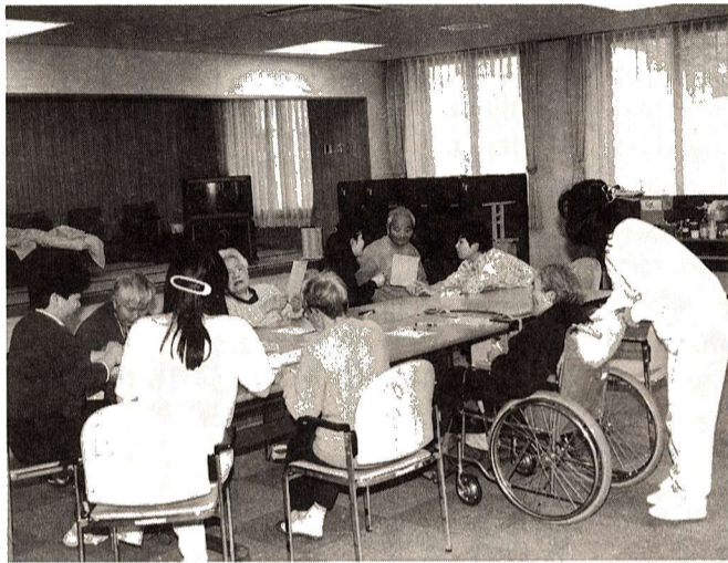
▲高齢者在宅サービスセンター「田園」の趣味いきがい活動

利用者を福祉センターまで送迎し、創作的活動・機能訓練などの各種サービスを提供する障害者のデイサービス事業が10月から始まります。高齢者在宅サービスセンター事業につき、在宅福祉の充実に努めていきます。 ■申請・問合せ 以下の申請については、在宅福祉課障害福祉係(福祉センター内)☎3012941へ。