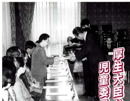
厚生大臣から民生委員・児童委員が委嘱されました。

民生委員は、社会奉仕の精神をもって、地域社会の中で生活に困っている方や心身に障害のある方、ひとり親世帯、ひとり暮らしや寝たきりのお年寄りの相談、指導、助言のほか、行政機関に対する協力活動を行い、社会福祉の向上に努めています。