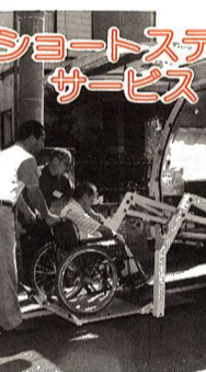
ショートステイサービス

対象 65歳以上の在宅で寝たきりの方 内容 6泊7日を限度に、老人ホームでお世話します。 費用 費用負担があります。