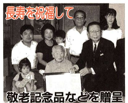
敬老記念品などを贈呈