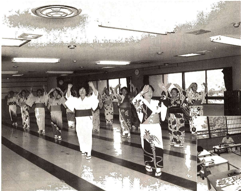
▲和気あいあいの民謡(踊)サークル

発行 福生市 〒197 東京都福生市本町5 編集 市長公室秘書広報課 市役所の代表電話番号 ☎ 0425-51-1511