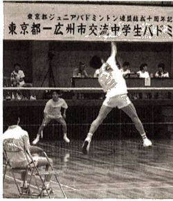
▲昨年行われた中国とのスポーツ交流

市では、昨年度から国際化施策の一環として、海外派遣事業を実施しています。 これは、市民の方々を海外に派遣することで、外国の文化、歴史、風土などを理解しながら、これからのまちづくりの役に立てていただこうとするものです。 今年度は、スポーツ交流として