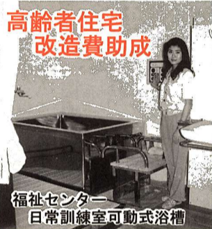
高齢者住宅改造費助成 福祉センター 日常訓練室可動式浴槽

対象 65歳以上で、常時寝たきりの状態、またはこれに準ずる状態が継続している方 内容 ・紙おむつ 1日につき5枚 ・布おむつ 1日につき5枚