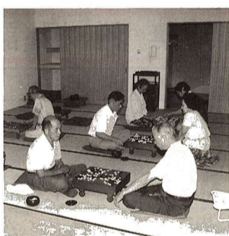
送迎バスを運行していますので、お気軽にご参加ください。

また、平成6年9月16日から平成7年9月15日の間に90歳になられた方には賞状と記念品、75歳以上の方には敬老金、65歳以上の方には敬老記念品をお贈りし