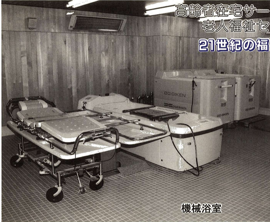
高齢者在宅サービスセンター事業 老人福祉センター事業… 21世紀の福祉をめざして