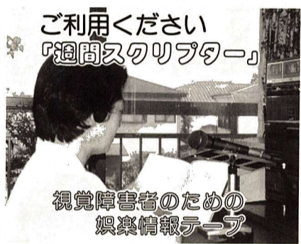
ご利用ください 『週間スクリーン』 視覚障害者のための娯楽情報テープ

朗読ボランティアグループ「福生いとでんわ」が編集宅配している『週間スクリーン』も創刊8年目を迎え、利用者から大変好評を得ています。