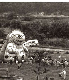
▲第4回ふっさ輝きフェスティバルから

基金は、公共施設整備、学校施設などの整備、庁舎建設や市民の国際交流を図る経費など、それぞれ目的を持つ積立基金です。