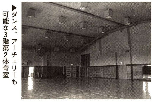
▶ダンス、アーチェリーも可能な3階第2体育室

福生地域体育館は、地域の人々とのふれあい、心の交流の場として、また心と体の健康づくりの実践の場として、誰もが気軽に利用できるよう運営していきます。皆さんご利用ください。 初心者にも適切な トレーニング指導 ダンス、 アーチェリーにも 利用できます 2階トレーニング室に専任トレーナーを配置し、体力の向上・ ◆幼児のプレイルームには 楽しい遊具がいっぱい