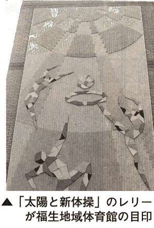
▲「太陽と新体操」のレリーフが福生地域体育館の目印