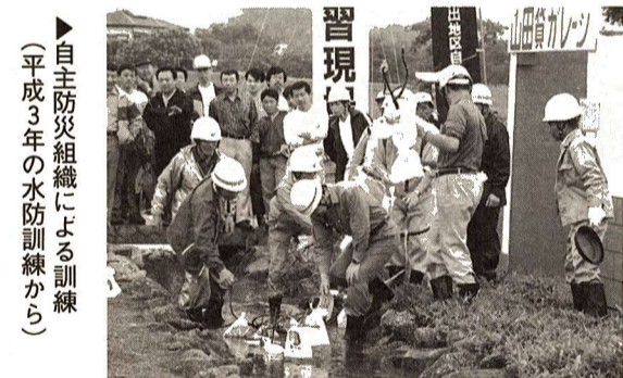
▶自主防災組織による訓練 (平成3年の水防訓練から)