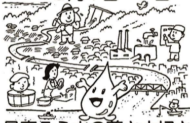
見直そう水の尊さ大切さ

水道の蛇口をひねるだけで、好きなだけ出てくる水、この便利さゆえにたい無駄に使っていないでしょうか。