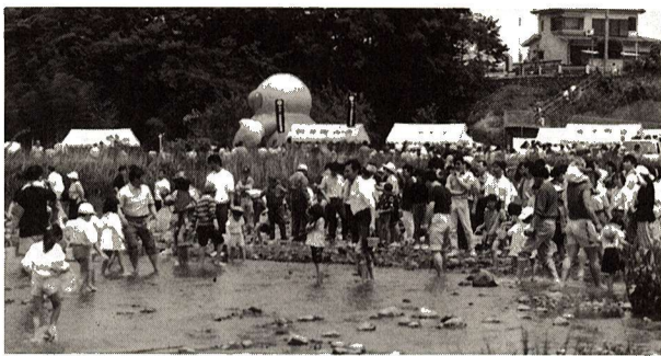
▶第2回ふっさ輝きフェスティバルから