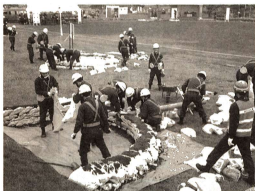
▲堤防の浸食を防ぐ月の輪工法 (平成3年の水防訓練から)