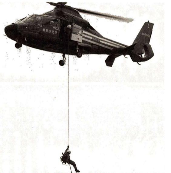
▲ヘリコプターによる流出家屋からの救助訓練 (平成3年の水防訓練から)

ご覧ください 大規模な水防演習 局地的な集中豪雨により多摩川が広範囲にはん濫し、人家などに危険が差し迫っているという想定で、地元の自主防災組織の方々と消防団員及び東京消防庁の誇る特殊水防小隊・消防ヘリなどによる大規模な水防演習を実施します。 実施機関 福生市・羽村市・瑞穂町・福生市消防団・羽村市消防団・瑞穂町消防団・自主防災組織・第九消防方面本部・福生消防署