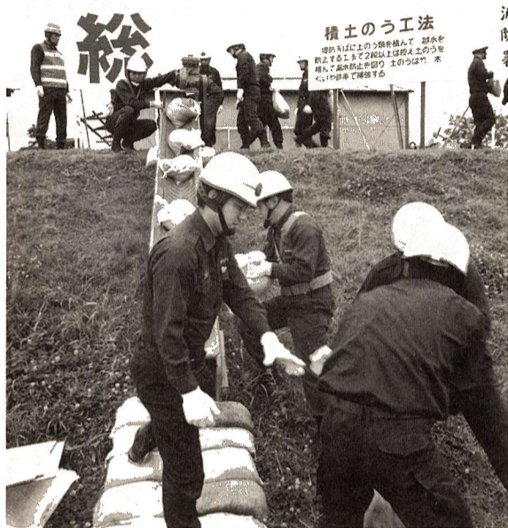
▲堤防からの越水を防ぐ積み土のう工法 (平成3年の水防訓練から)

発行 福生市 〒197 東京都福生市本町5 編集 市長公室秘書広報課 市役所の代表電話番号 ☎ 0425-51-1511