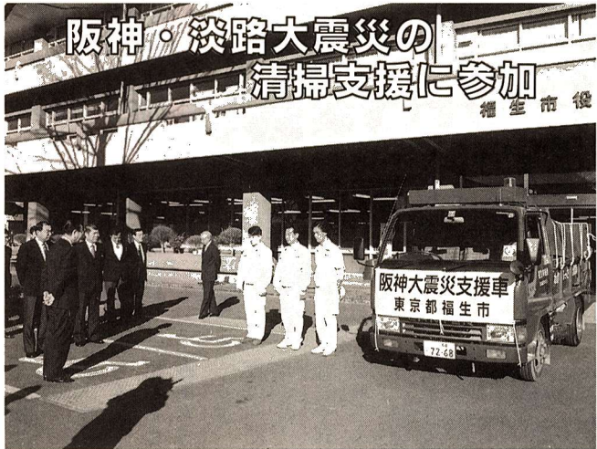
市では、2月21日から26日まで、阪神・淡路大震災で甚大な被害を受けた兵庫県西宮市へ、清掃支援に行きました。支援の内容は、市のじんかい車が、西宮市のじんかい車と協力して、震災のために粗大ごみと化した大量の家具や電気製品などを収集して回るといったものでした。