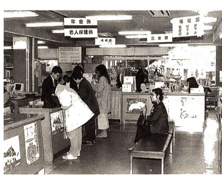
より効率的な行政サービスの提供を目指します