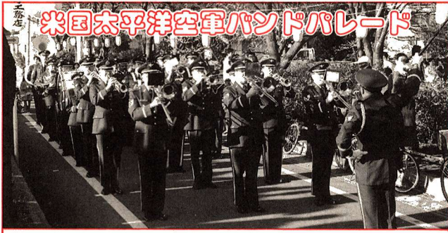
米国太平洋空軍バンドパレード

日時 1日(土) 午後4時～4時30分(雨天中止) 場所 南田園3丁目から陸橋の間