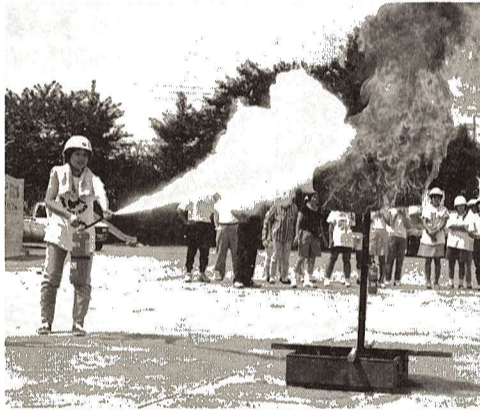
▶昨年の防災訓練から(写真と本文は関係ありません)

この結果から見ても、まだ、食糧・飲料水・非常持出品を備蓄している家庭が少ないということがわかります。地震はいつ来るかわかりません。万が一に備えて日ごろから準備しておくことが大切です。皆さんのご家庭はどうですか。(内線246)へ。