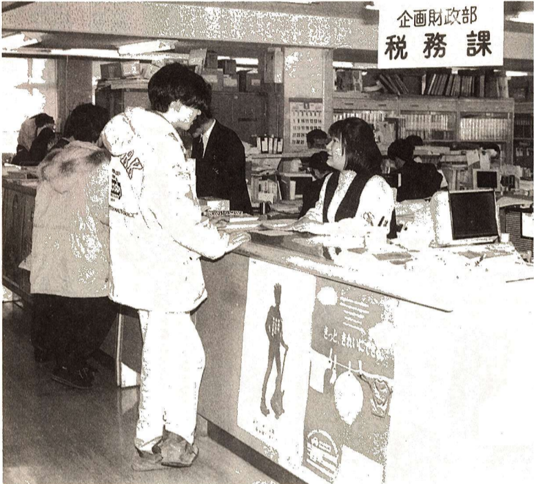
企画財政部 税務課

請などをされる方は、市・都民税の課税証明書などが必要となる場合がありますので、必ず申告をしてください(市の国民健康保険に加入している方は、前年中に所得がなかった場合でも申告していただかないと、国民健康保険税の軽減を受けることができません)。