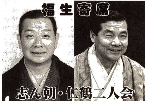
志ん朝・仁鶴二人会

昔の落語を昔のままやりたい、古典ならではの良さを追求する古今亭志ん朝。大阪文化の顔、数少ない貴重な上方古典派落語の中心人物。笑福亭仁鶴。関東、関西の対照的な語り口がたんのうでできます。これこそ落語の極めつけです。 日時 1月28日(土) 午後6時30分開演 場所 市民会館大ホール 全席指定 2,000円 前売りチケット好評発売中