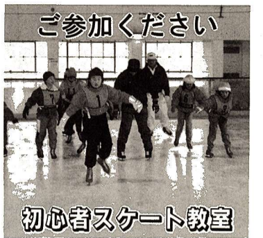
初心者スケート教室