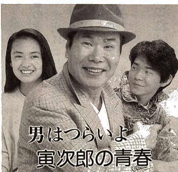
男はつらいよ 寅次郎の青春

寅さんは九州・宮崎のある町で「髪結いの亭主」のようにのんびりと居候を決め込んでいた。一方、柴又では、東京に就職した泉が、週末になると満男の家に遊びに行き、さくらや博