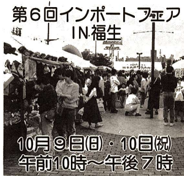
第6回インポートフェア IN 福生 10月9日(日)・10日(祝) 午前10時～午後7時

福生市商工会では、今年も国道16号沿いの横田基地前商店街を中心会場に、インポートフェアを開催し各国の輸入品を販売します。