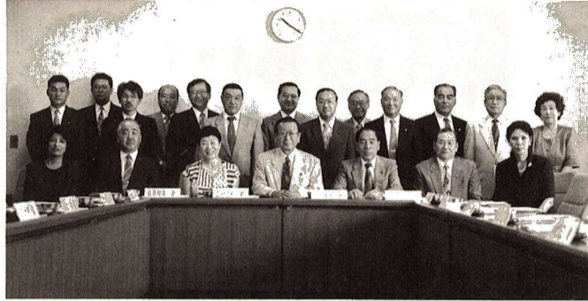
◎市民海外派遣団員の皆さん◎ (敬称略・順不同)

ちづくりに役立てていただこうとするものです。派遣期間 10月18日(火)～22日(土)