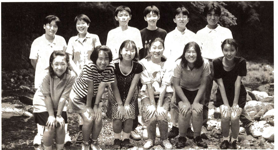
◎派遣生の皆さん◎ (敬称略)