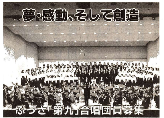
夢・感動、そして創造